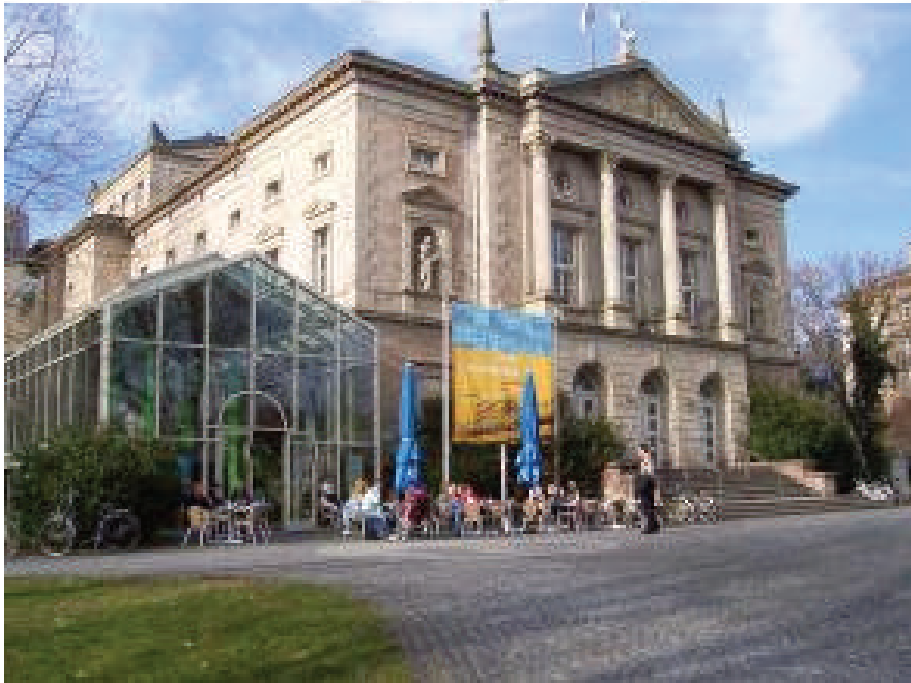
Gastronomie & Veranstaltungen in Theaterambiente